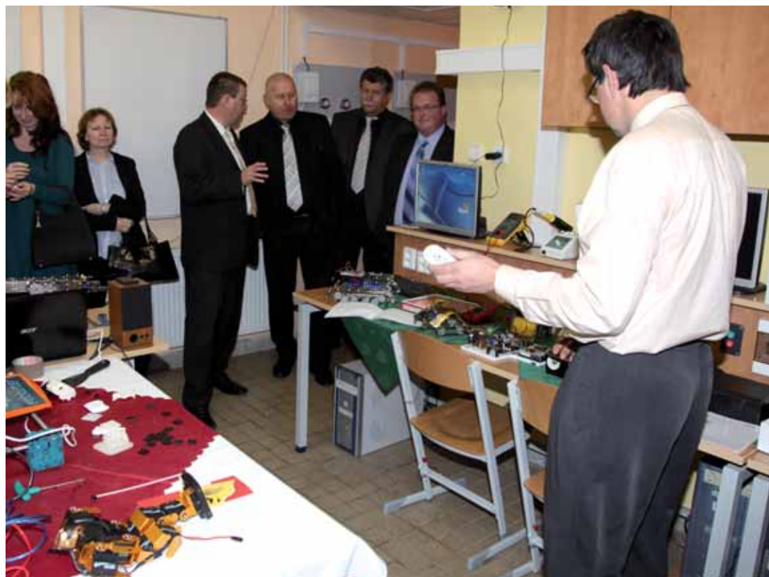
V laboratoři a učebně mechatroniky v podbořanské škole byli v rámci Dne otevřených dveří i představitelé města, kraje a ministerstva školství ČR.

Mezi šestnáct Páteřních škol Ústeckého kraje patří také Gymnázium a Střední odborná škola v Podbořanech. Nedávno se v areálu školy v ulici Kpt. Jaroše uskutečnil Den otevřených dveří.