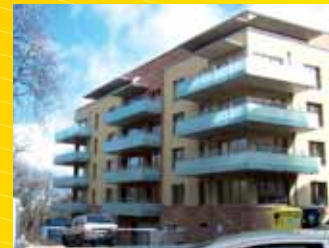
Bytový dům Hvězda Praha