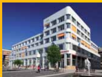
Palác Zdar Ústí n.L.