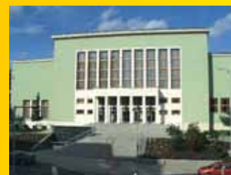
Dům kultury Ústí n.L.