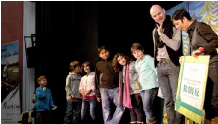
Horský dětský domov využije peníze na ozdravné pobyty, na kulturní a další činnost dětí.

V Mostě se děti sešly v kulturním domě Repre, kde pro ně Barborka s Prokúpkem měli připravené představení, tentokrát v podání populární trojice Maxim Tubulenc. Ta si připravila pásmo pohádek proložené písničkami Dlouhý, široký a ještě širší. Ještě než trio populárních tloušťků předvedlo nejmenším své verze známých pohádek, přišly si na pódium pro dárky ředitelky mosteckého dětského domova a kojenického ústavu. Těm společnost Vršanská uhelná a Litvínovská uhelná nadělily shodně po padesáti tisících korunách. Při přebírání symbolických šeků ředitelky jednotlivých za-