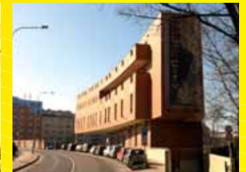
Music city Praha

NABÍDKA PLATÍ I PRO MALOODBĚRATELE A SOUKROMÉ STAVEBNÍKY