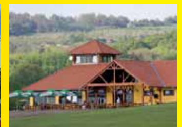
Golfový klub Terasy