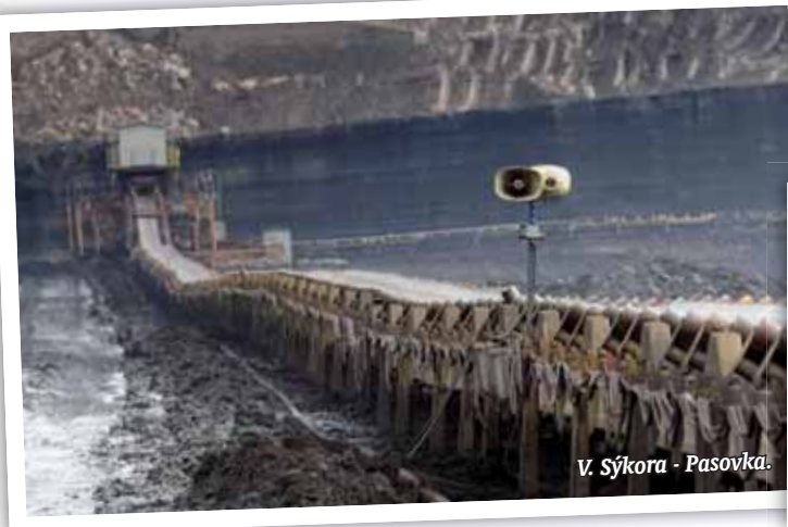
V. Sýkora - Pasovka.

Ta zpráva z médií nás, na rozdíl od četných, dotýkajících se těžby uhlí na Mostecku, hodně potěšila. V průběhu sezóny navštívil lom také muzikant a skladatel Jiří Stivín. Exkurzi na Uhelné safari prý dostal jako dárek od své přítelkyně. „Bral jsem to jako vtip, ale když jsem viděl velkorypadlo, tak mě naprosto oslnilo a inspirovalo. Ta železná obluda vydává neuvěřitelné zvuky. V mé skladbě bude velkorypadlo dunit, chrčt, škrábat, a my k tomu budeme hrát. Rytmus rýpadel je hodně odvázaný, ale já mu se saxofonem a flétnou budu konkurovat,“ uvedl na iDnes.cz Jiří Stivín. Balada pro velkorypadlo měla premiéru 19. listopadu při tradičním koncertu Pocta sv. Cecilii v pražském Rudolfinu. Škoda, že ji stáda muflonů, která se prohánějí v lomech, neuslyší... (má)