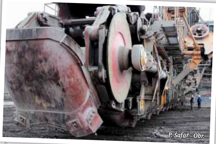
P. Šafář - Obr.