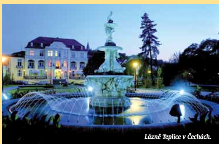
Lázně Teplice v Čechách.