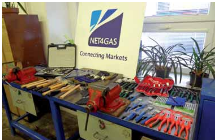
Některé z cen pro vítězné školy, které byly pořízeny z finančního daru společnosti NET4GAS.

V rámci setkání se starosty, která se na Krajském úřadě Ústeckého kraje konala na jaře letošního roku, byl zároveň prezentován projekt „Řemeslo má zlaté dno“. Zapojuje se do něj celkem patnáct škol, které představovaly své řemeslné obory v průběhu jednotlivých akcí.