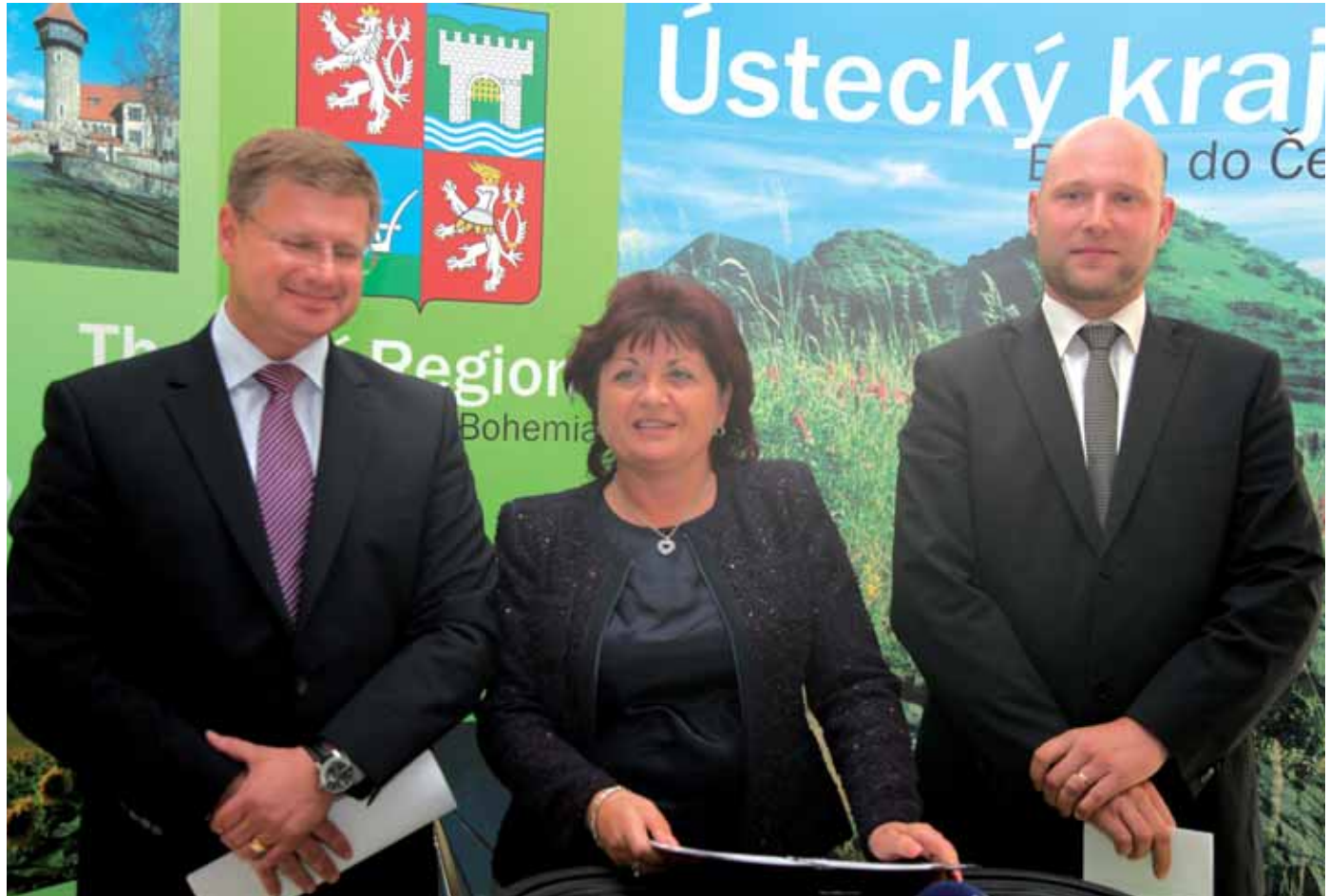
O zásadních závěrech konference hovořila hejtmanka Jana Vaňhová i s novináři. Spolu s ní jsou na snímku 1. náměstek ministra vnitra Jaroslav Hruška (vpravo) a Daniel Volák, první náměstek ministra spravedlnosti ČR.

lasti pravicového extremismu. Přední čeští odborníci a vrcholní představitelé státní správy zabývající se touto problematikou se shodli na nutnosti navázat společný dialog a zejména zahájit společnou pomoc městům a obcím, které se potýkají s hlavními projevy, které doprovází sociálně vyloučené lokality, na svém území. Praktickou pomůckou zejména pro starosty, kterou připravil Ústecký kraj a představil v rámci bezpečnostní konferen-