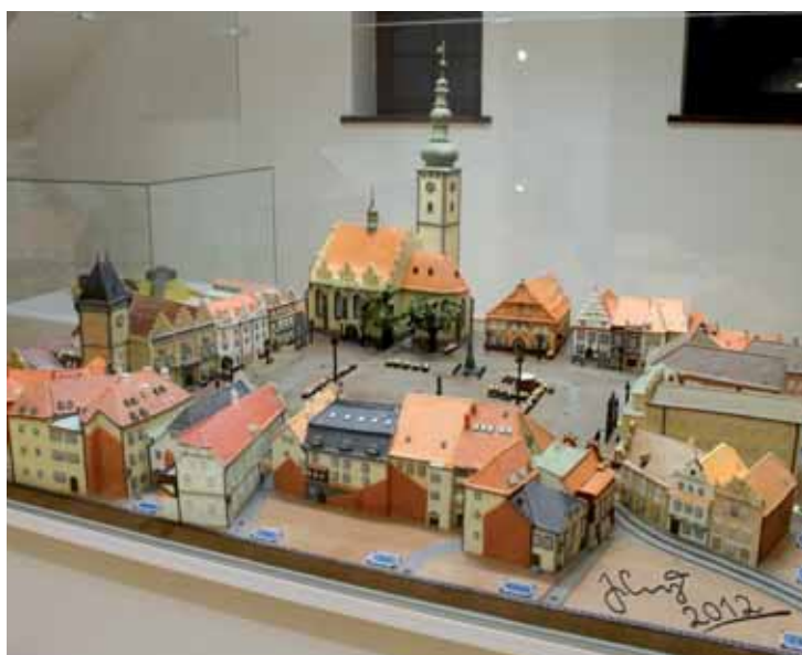
Marcipánový model tábořského náměstí.