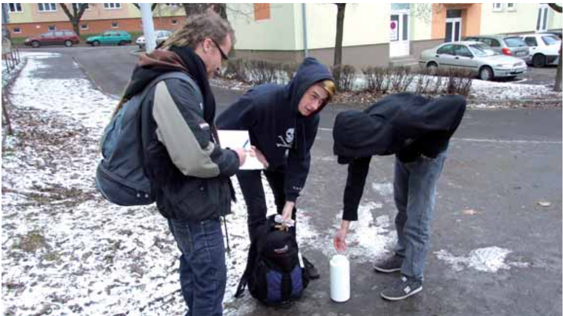
Terénní pracovníci MONA sbírají na ulici i odhozené injekční stříkačky.

Právě liberecký Dům na půl cesty a služby sociální prevence jsou financovány z takzvaného integračního programu IP1 – jde tedy o finance, které se Libereckému kraji podařilo získat z evropských dotací. Sám Liberecký kraj ale letos podpořil ještě další tři protidrogové služby sdružení Most k naději. Na terénní program pro uživatele drog a na provoz K-center v Liberci a v České Lípě přispěl letos částkou 1 milion 140 tisíc korun. „Finanční prostředky určené na tento typ služeb se na národní úrovni meziro-