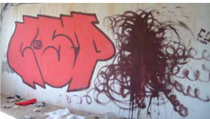
Při terénní práci se streetworkeri dostávají do různých míst.

V Liberci a v České Lípě navíc sdružení Most k naději provozuje kontaktní centra, takzvaná K-centra. Tady si drogově závislí mimo jiné mohou vyměnit použité injekční materiály za sterilní, mohou dostat základní zdravotní ošetření, absolvují také různé testy, například na přítomnost drog v moči, a v Liberci mají dokonce možnost si vyprat.