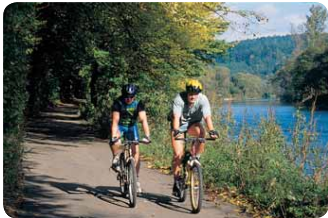
Využijme konec léta a poznejme kraj ze sedla kola.

Velkým rozmachem se určitě může pochlubit cyklistická síť ve středních Čechách, která se v poslední době zvětšuje, vylepšuje a propojuje s hlavním městem.