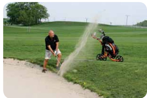
Golf se stává v poslední době sportem pro každého a přestává být kratochvílí jen bohaté.

Vedle tradiční cykloturistiky se v poslední době objevil nový trend, a sice in-line brusle. Jedno takové hřiště pro milovníky tohoto sportu vyrostlo v areálu Vrchbělá pod názvem In-line park Bezděz, ten nabídne nespočet možností sportovního i turistického vyžití. Návštěvníci všech věkových kategorií se mohou těšit na dvě in-line dráhy o celkové délce cca 7,5 km. Dále zde budou běžecské trasy (v zimě upravené pro běžkaře), rozsáhlá síť cyklostezek a rozhledna. Pro děti se budují pěší naučné trasy pro lepší poznávání přírody s motivem loupežnické stezky. Pro odpočinek bude k využití turistické centrum, které nabídne například ubytování, restaurace, prostor s expozicí historie a přírodních charakteristik kraje, půjčovnu a servis bruslí a kol, lanové centrum a paintball, dětské hřiště i kemp. Vrchbělá by se tak nejpozději do dvou let měla proměnit v obrovský atraktivní prostor pro turisty, sportovce a milovníky rodinných výletů. V současnosti jsou už hotovy demoliční práce a byly započaty zemní práce pro založení objektů cyklostezek a Multifunkčního turistického centra. Celkové náklady projektu činí odhadem cca 132 milionů korun a měly by být hrazeny z fondů Evropské unie z Regionálního operačního programu regionu soudržnosti Střední Čechy.