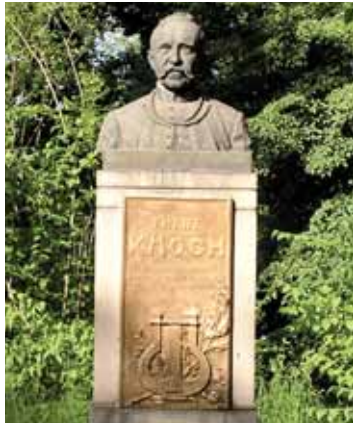
Busta Františka Kmocha na Kmochově ostrově v Kolíně.

Není snad Čech, který by neznal jeho dílo. Dnes se dokonce koná i slavný festival Kmochův Kolín. A právě k tomuto městu měl František Kmoch celý život vřelý vztah. Kmochův otec, krejčí, hrál na klarinet a produkoval lidovou hudbu. Již jako dítě se František naučil hrát na housle a v deseti letech psal první drobné skladby. Narodil se 1. srpna 1848. V roce 1868 studoval na pedagogické škole v Praze a roku 1869 nastoupil na místo učitele v Suchdolu. Kromě výuky hrál často v různých orchestrech, skládal hudbu a začal dirigovat. V roce 1873 byl odvolán z učitelského místa s odůvodněním, že zanedbával svoje učitelské povinnosti a místo toho vystupoval s hudebními soubory na plesech. Je však také možné, že šlo o politické rozhodnutí související s Kmochovou neskrývanou podporou Sokola. Kmoch byl totiž dirigentem kolínského Sokolského