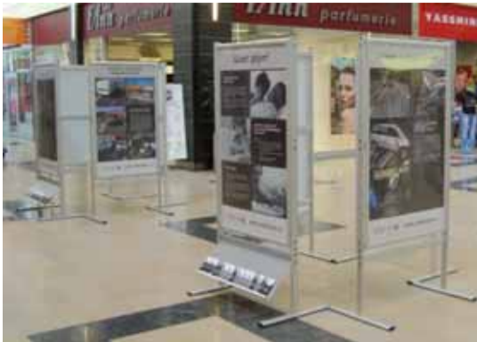
Putovní výstava Uber plyn!, kterou bylo možné zhlédnout v srpnu v NC Géčko, je v těchto dnech k vidění v prostorách semilské radnice.

V liberecké nemocnici je sice neustále připravený tým obětavých, vzdělaných a technicky vybavených zdravotníků, ale bohužel existují i poranění neslučitelná se životem a existují a dlouho ještě budou existovat následky, které nelze odstranit.