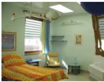
Útulné prostředí liberecké porodnice.

Gynekologicko-porodnické oddělení Krajské nemocnice Liberec je tu pro vás od roku 1912. Sídlí v Pavilonu péče o matku a dítě (PPMD), kde jsou soustředěna všechna oddělení zajišťující zdravotnickou péči o ženy a děti. Ročně v liberecké porodnici přijde na svět okolo 1500 novorozenců. Na našem oddělení pečujeme