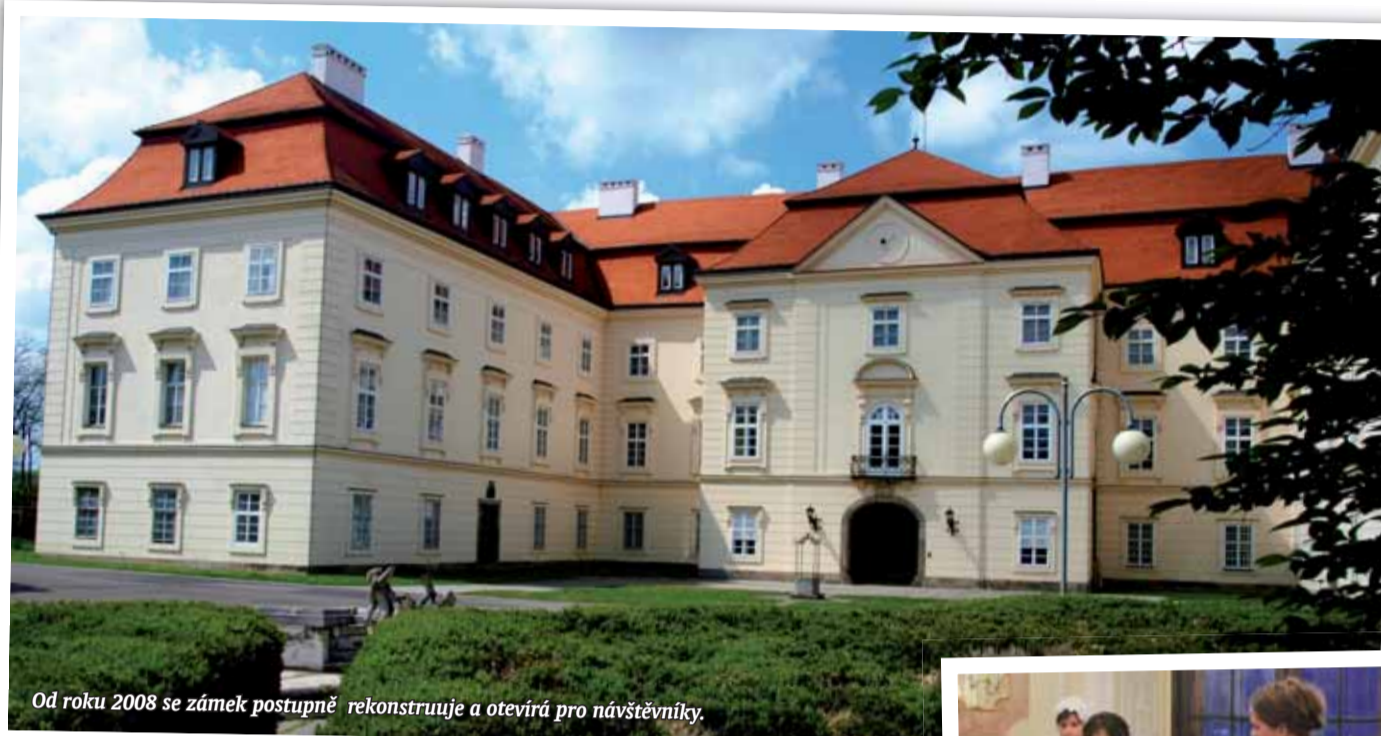
Od roku 2008 se zámek postupně rekonstruuje a otevírá pro návštěvníky.

Zámek Napajedla byl po dlouhá léta zcela uzavřen a nikdy nebyl přístupný veřejnosti. Od roku 2008 se postupně rekonstruuje a otevírá pro návštěvníky. Kromě řady aktivit, jako jsou prohlídky historických sálů, cestopisná výstava Afrika cestovatele Rudolfa Švaříčka či jedinečná výstava Filmové žně, která mapuje film 30. a 40. let 20. století, disponuje i ubytováním v nádherných stylových zámeckých pokojích. Ty mají názvy Odvaha, Vitalita nebo Rádost. Prostory historického sídla jsou vhodné i pro organizování svateb, rodinných oslav nebo firemních akcí. Pro gurmány i laiky pořádá Moravský kulinařský institut, který v zámku sídlí, kurzy vaření. Konají se většinou v podvečerních hodinách. Všechny aktuální kurzy najdete na www.mokul.cz . V zámeckém parku můžete trénovat vaše odpaly na místním golf driving range, jenž se nachází přímo v zahradě. Uvnitř budovy funguje také trenážer Full Swing s nejnovějšími verzemi software E6 a LS3, sídlí zde také golfový klub J. A. Bati. Kromě klasických zámeckých prohlídek se pořádají v průběhu léta každý čtvrtek ve 20.00 a ve 21.00 hodin hrané prohlídky. V loňském roce zámek