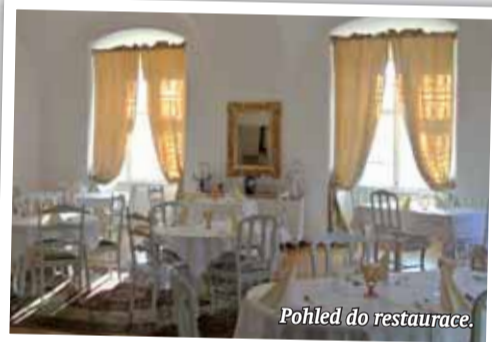
Pohled do restaurace.

Zámek Napajedla je otevřen od středy do neděle od 10 do 22 hodin. Prohlídky zámku se konají od 10 do 16 hodin. Výstavy jsou otevřeny od 10 do 18 hodin, kavárna a restaurace v tyto dny od 10 do 22 hodin (v neděli do 18 hodin), golf denně, zámecké ubytování neomezeně. Více na www.zameknapajedla.cz , www.jabatagolfclub.cz .