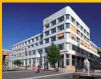
Palác Zdar Ústí n.L.