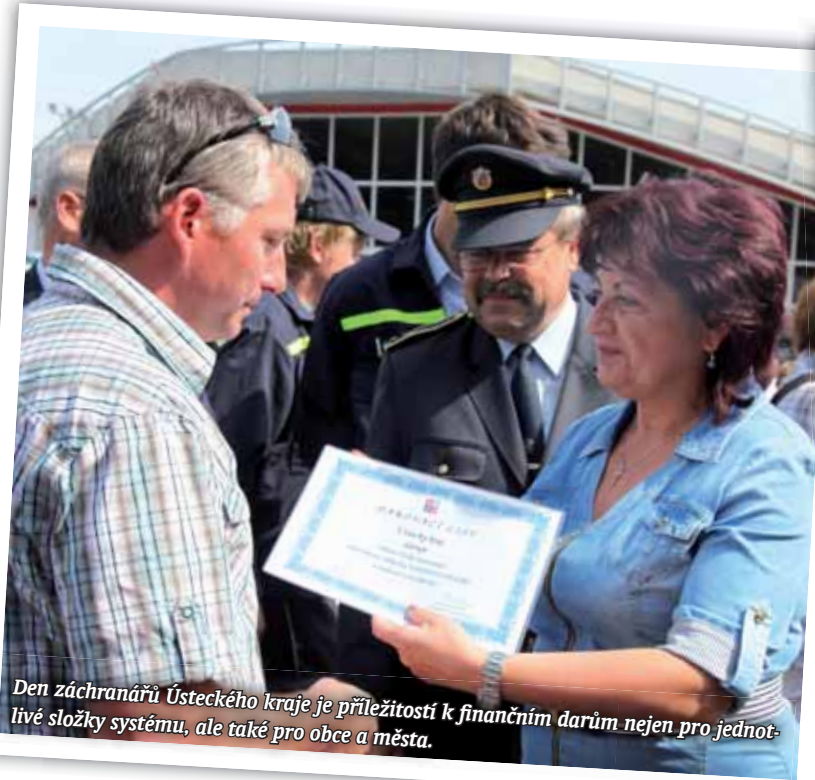
Den záchranářů Ústeckého kraje je příležitostí k finančním darům nejen pro jednotlivé složky systému, ale také pro obce a města.

Prvním konkrétním krokem vycházejícím z Ústeckého programu zaměstnanosti 2020 je vytvořit v rámci příspěvkových organizací Ústeckého kraje zhruba 480 nových pracovních míst. Celkem své požadavky předložilo 20 organizací z oblasti sociální a zdravotní (představa více než 70 míst), 85 škol a školských zařízení (více než 380 míst) a 10 organizací z oblasti kultury (přibližně 20 míst). Jedná se například o profesie jako sociální pracovník, rehabilitační pracovník, údržbář, pečovatel, fyzioterapeut, zahradník, asistent pedagoga, lektor, domovník, vrátný, řemeslné obory, uklízeč a různé pomocné profesie. Ve většině se jedná o dlouhodobá pracovní místa, nikoli o sezónní práce. Financování pracovních míst se plánuje v rámci aktivní politiky zaměstnanosti a projektů ESE. Je potřeba dát práci těm, kteří chtějí pracovat, a více motivovat ty, kteří pracovat nechťejí.