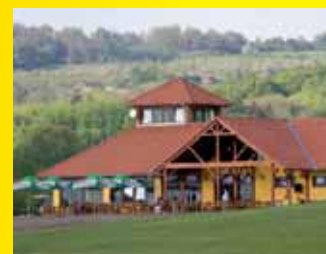
Golfový klub Terasy