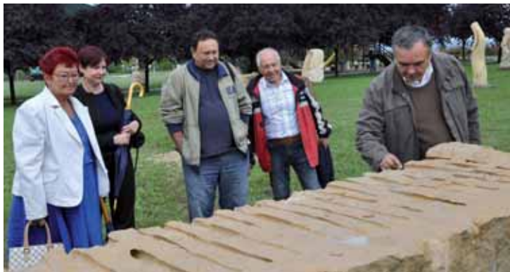
Účastníci slavnostního zahájení 4. ročníku Sochařského sympozia u kvádrů pískovce.

Sochárení samotné je velice příjemné nejenom pro sochaře, ale i pro návštěvníky, kterých je opravdu hodně a provází sochaře od první chvíle zahájení. Je