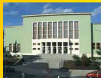
Dům kultury Ústí n.L.