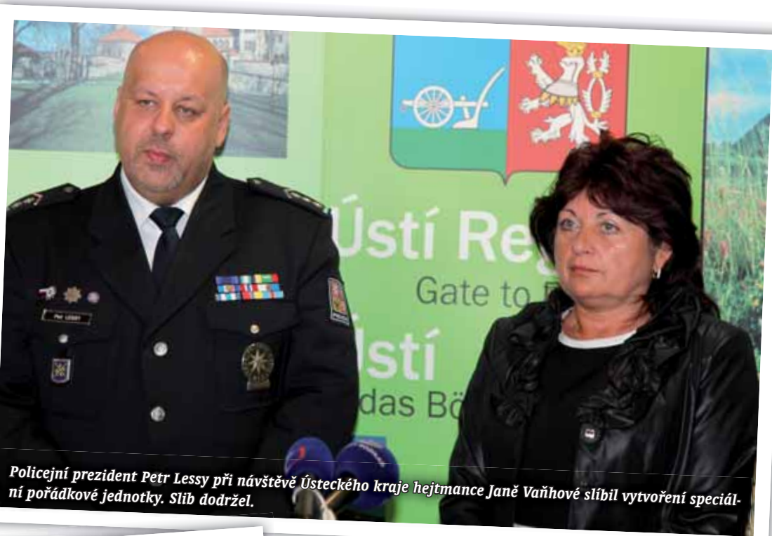
Policejní prezident Petr Lessy při návštěvě Ústeckého kraje hejtmance Janě Vaňhové slíbil vytvoření speciální pořádkové jednotky. Slib dodržel.

zpráv, ale podle aktuální Bezpečnostní analýzy Ústeckého kraje dochází k rozšíření kriminogenního chování do nových lokalit v našem kraji, čímž roste nebezpečí vzniku nových vyloučených lokalit, nebo rozšíření stávajících. Stále reálnější je hrozba opakovaní rozsáhlejších nepokojů, ale už zejména na Šluknovsku.