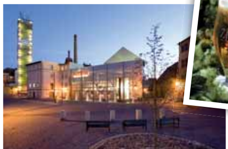
Chrám Chmele a Piva v zóně kandidující na UNESCO.

Historický střed města, prohlášený v roce 1961 památkovou rezervací, nabízí řadu významných staveb a rozmanitost slohů od doby románské po secesi. Vyhláše-