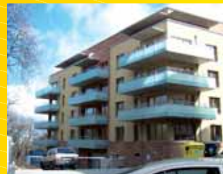
Bytový dům Hvězda Praha