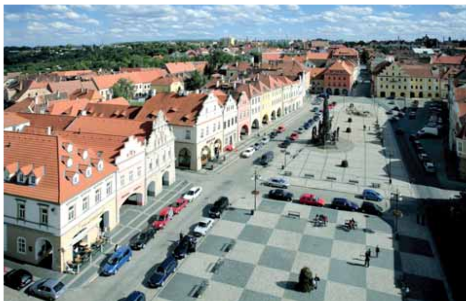
Pohled na centrum města z radniční věže.