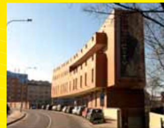
Music city Praha

NABÍDKA PLATÍ I PRO MALOODBĚRATELE A SOUKROMÉ STAVEBNÍKY