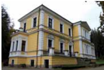
Památník Dvořáka ve Vysoké u Příbrami.