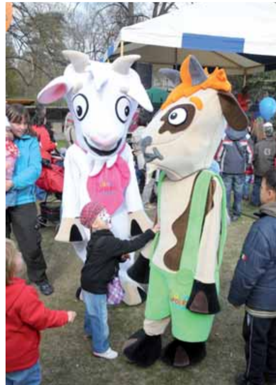
Maskoti Rodinného zápolení koza Róza a kozlík Rozmarýnek.

di. V závěru roku se z účastníků, jež splní potřebný počet bodů, losují výherci sportovních potřeb, zájezdů a dalších cen. „Pro rodiny s dětmi po-