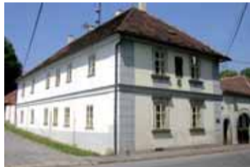
Dvořákův dům v Nelahozevsi.