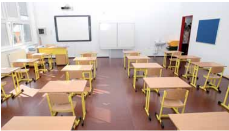
Nové prostory v Základní škole ve Vysokém Újezdě.

Základní škola ve Vysokém Újezdě se rozrostla. Před týdnem se konalo slavnostní otevření přístavby.