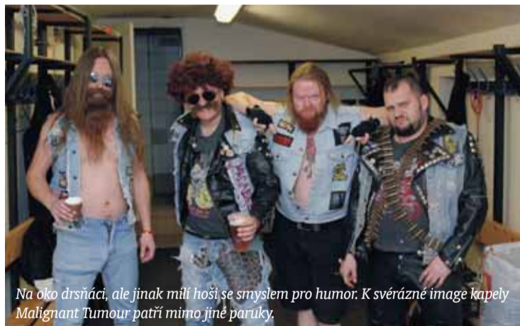
Na oko drsní, ale jinak milí hoši se smyslem pro humor. K svéráznému image kapely Malignant Tumour patří mimo jiné parůčky.

Ostrava | Ostravská skupina Malignant Tumour si splnila svůj muzikantský sen. Nedávno si zahrála na jednom pódiu se svými idoly z dětství – americkou legendární kapelou Slayer.