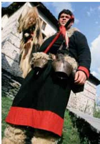
Tradice jsou v Bulharsku stále živé. Muž na snímku je oblečen v kroji, který se používá během velikonočních svátků.

rodin. Podle vylosovaného pořadí se budou střídavě starat o ovce až do podzimu. Ty se jim odvděčují výborným mlékem, sýrem, masem a samozřejmě vlnou, kterou Pomaci zpracovávají v přízi a dodnes umějí utkat legendár-