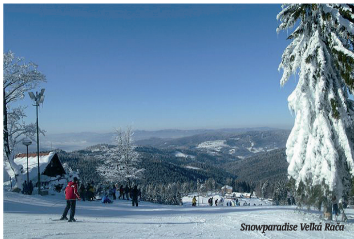
Snowparadise Velká Rača

Ve Ski areálu Řeka, který najdeme v moravskoslezských Beskydách, poblíž města Třinec, na konci obce Řeka, si lze vybrat mezi velkou a malou sjez-