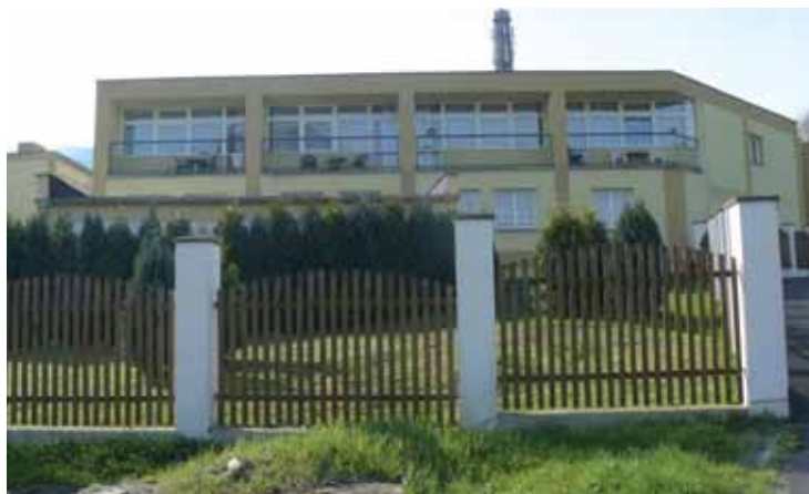
Exteriér domova v klidné Klášterní ulici.

Myslím, že je to poradenská činnost jak pro rodiny, tak samotné klienty. To bychom do konce letošního roku rádi změnili, alespoň v Ústí nad Labem. Pro toto individuální poradenství hledáme nyní externího partnera, nejlépe občansko-prospěšnou společnost. Když se to nepovede, ujmeme se toho úkolu sami.