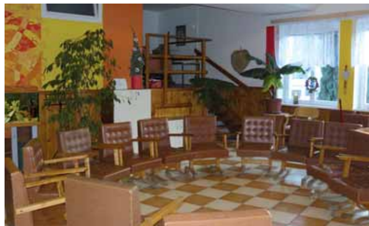
Společenskou místnost využívají senioři k terapiím i zábavě.