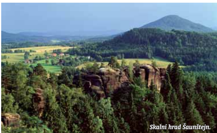
Skalní hrad Šaunštejn.

Text: MetroPol, foto: V. Sojka a Z. Patzelt, archiv Národního parku