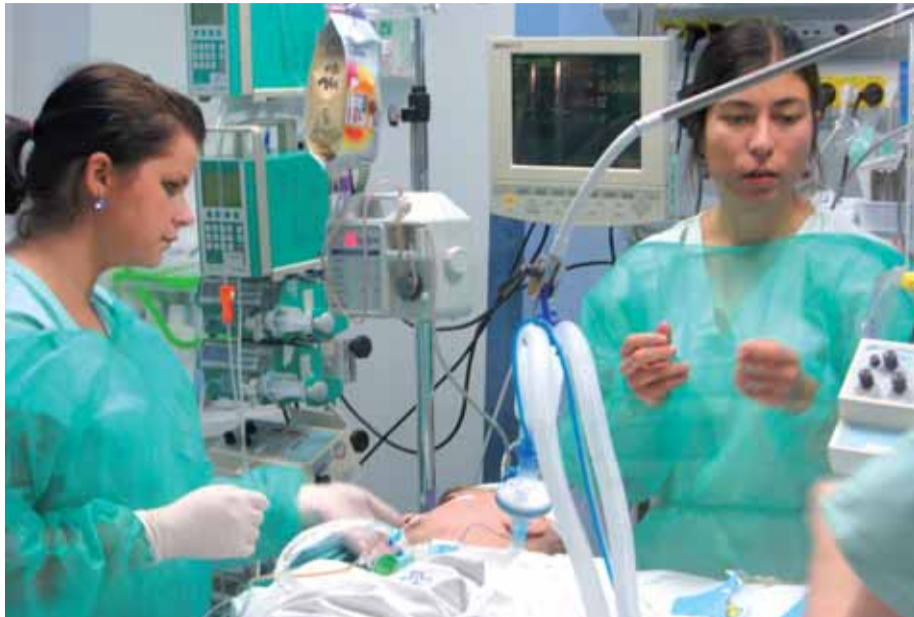
Pohled do moderně vybaveného pracoviště iktové jednotky při Neurocentru Krajské nemocnice Liberec, a. s.

„Iktová jednotka je dnes základním prvkem umožňujícím zvýšit úroveň dosud poskytované péče o nemocné s cévním onemocněním mozku v KNL. Počet pacientů přijatých na lůžko intenzivní péče narostl v roce 2011 čtyřnásobně oproti roku 2010. Počet pacientů s cévní mozkovou příhodou ošetřených v našem Neurocentru se tak v krátkém období zvýšil o 36 procent. V prvním roce využívání iktové jednotky jsme se soustředili hlavně na usazování osvědčených postupů v nových podmínkách a na hledání cest poskytování péče na nejvyšší úrovni. Letos se zaměříme na standardizaci logisticky náročných postupů tak, aby se staly rutinními. Budeme pokračovat v jejich modernizaci v souladu s nejnovějšími poznatky a mezinárodními odbornými