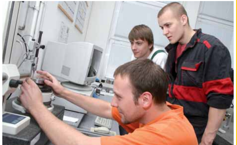
UNIVERZITA J. E. PURKYNĚ V ÚSTÍ NAD LABEM Fakulta výrobních technologií a managementu

Název: Fakulta výrobních technologií a managementu • Sidlo: Na Okraji 1001, Ústí nad Labem, 400 96 Kontakt: Tel.: 475 285 511, fax: 475 285 566 • e-mail: kontakt@fvtm.ujep.cz , • www.fvtm.ujep.cz