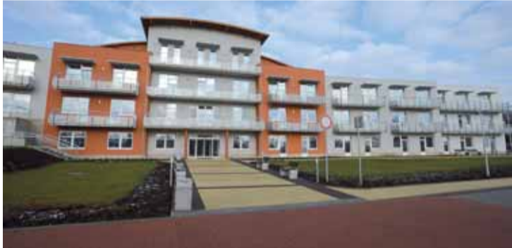
Nový domov seniorů v Berouně nabízí stovku lůžek.

Středočeský hejtman David Rath se přijel podívat do nedávno postaveného Domova seniorů v Berouně, kde nyní probíhá zkušební provoz. Poslední nedostatky se už napravují a brzy se bude konat slavnostní otevření.