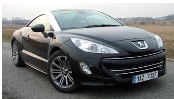
Kladivo na Audi

Hned zkraje je nutné konstatovat, že Peugeot RCZ je zcela mimořádný vůz počínaje vnějšími tvary odkazujícími na speciály Le Mans a konče pohonnou jednotkou od BMW. Podle drsného zvuku benzinového turba byste sotva hádali, že jde o pouhou šestnáctistovku! Výkon dvě stě koní a k tomu spotřeba 6,9 l/100km! V praxi jsme ji sice překročili hodnotou 8,2l, ale vůz dostával hodně zabrat. RCZ vás neustále svádí k hrátkám s akcelerací, přičemž zpomalení patří díky skvělým brzdám také k jeho silným stránkám. Svádí vás i k častějšímu řazení. Motor při následném zrychlení dokáže vyloudit nádherný chorál závodního speciálu! S Peugeotem RCZ zapomenou na dobré ekologické mravy i vynavači jinak plynulý jízdy.