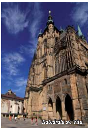
Katedrála sv. Víta.