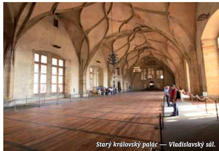
Starý královský palác — Vladislavský sál.