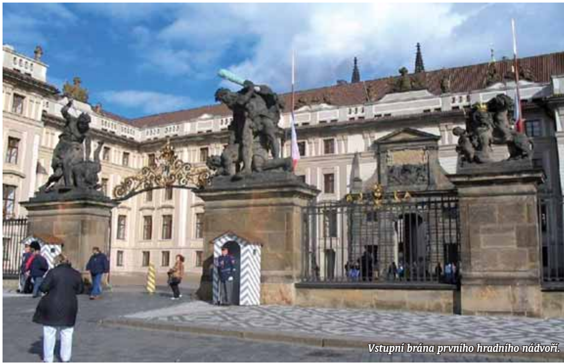
Vstupní brána prvního hradního nádvoří.

něním vystavěny obranné věže na severní straně – Prašná věž, Nová bílá věž a Daliborka. Architekt Benedikt Ried přestavěl a rozšířil i královský palác o velkolepý Vladislavský sál. Přestavba hradu vyvrcholila za vlády Rudolfa II. Císař se na hradě natrvalo usídlil a začal jej přestavovat v důstojné a velkolepé středisko říše, přitažlivé pro diplomaty, umělce i vzdělance. K umístění svých bohatých uměleckých a vědeckých sbírek založil severní křídlo paláce s dnešním Španělským sálem. Poslední velká přestavba hradu, která jej proměnila v reprezentační sídlo záměckého typu, se uskutečnila ve druhé polovině 18. století. V té době byla hlavním městem říše Vídeň. Hrad postupně chátral a jeho umělecké poklady byly ochuzeny rozprodejem zbytků rudolfinských sbírek. Po vzniku samostatné Československé republiky v roce 1918 se Pražský hrad stal opět sídlem hlavy státu. Nutné úpravy byly svěřeny slovínskému architektu Josipu Plečnikovi. Pražský hrad je dnes také významnou kulturní a historickou památkou. Jsou zde uchovávány korunovační klenoty, pozůstatky českých králů, vzácné křesťanské relikvie, umělecké poklady a historické dokumenty. V jeho zdech se odehrály události významné pro celou naši zem.