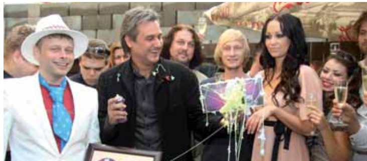
Křest 2CD Muzikálu Naháči si užili všichni jeho protagonisté.