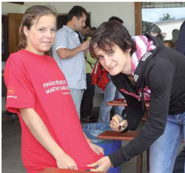
Martina Sábliková podepisuje tričko jedné ze soutěžících z děčinské ZŠ a MŠ ve školní ulici.

Boj o prvenství byl dramatický až do samotného závěru. Po pěti soutěžích měly totiž tři školy shodně 39 bodů. Žádná s disciplín, tedy skok do dálky, běh, hod na cíl, šplh či přeskakování laviček a dribling na čas se slalomem mezi kužely, nerozhodla o tom, kdo je nejlepší. Nastavovala se tudíž šestá disciplína, již byla běžecká štafeta. Tu nakonec nejlépe zvládla Základní škola Moravská Třebová, která si z Dřítině odnesla šek na 600 tisíc korun od Skupiny ČEZ a Nadace ČEZ. Druhé místo obsadila a 400 tisíc získala ZŠ Plzeň Kralovická. Dvě stě tisíc za třetí místo připadlo pražské zá-