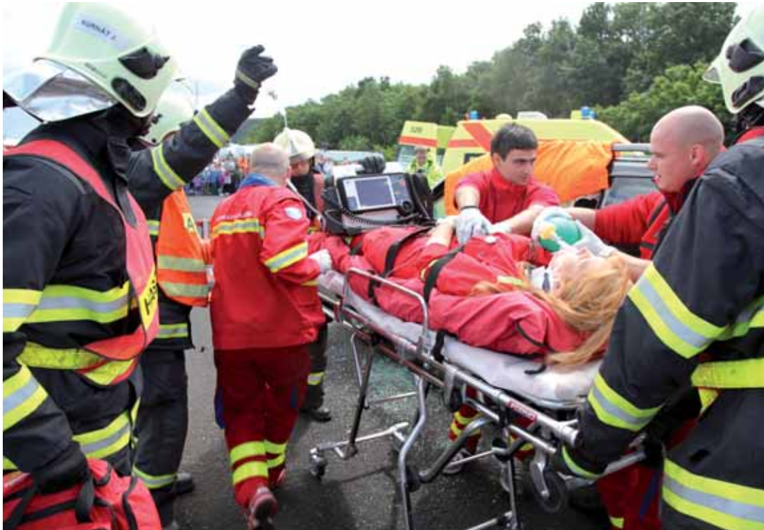
Nejvíce diváků měla simulovaná dopravní nehoda s nasazením zdravotníků, hasičů i policistů...

ky Tohatsu VC85BS, přičemž hodnota každé z nich je téměř čtvrt milionu korun. Sumárně tedy kraj věnoval svým „záchranářům“ techniku a vybavení za 8,135 milionu korun. A největší dar přišel hned vzápětí: firma Net4Gas, která zajišťuje přes území